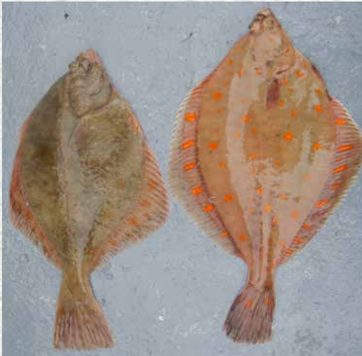
Gerne verwechselt: Flunder (links) und Scholle.

Die Flunder ist ein Plattfisch, der an das Leben auf dem Boden von Gewässern angepasst ist. Der Körper ist seitlich abgeflacht und asymmetrisch aufgebaut, da beide Augen auf der gleichen Körperseite liegen. Die Durchschnittsgröße der Flunder liegt bei 20-30 cm, bei einem mittleren Gewicht von 300 g. In Ausnahmefällen können sie bis zu 60 cm groß und bis zu 3 kg schwer werden. Die Bauchseite ist fast weiß, die Oberseite kann dem Untergrund angepasst werden und hat grünliche bis rotbraune Töne, teilweise mit rötlichen Flecken. Entlang der Seitenlinie liegen deutlich spürbare Knochenhöcker. Rücken- und Afterflosse bilden vom Schwanzstil ausgehend einen seitlichen Flossensaum. Die Rückenflosse reicht vom Auge bis zum Schwanzstiel, die Afterflosse von Höhe